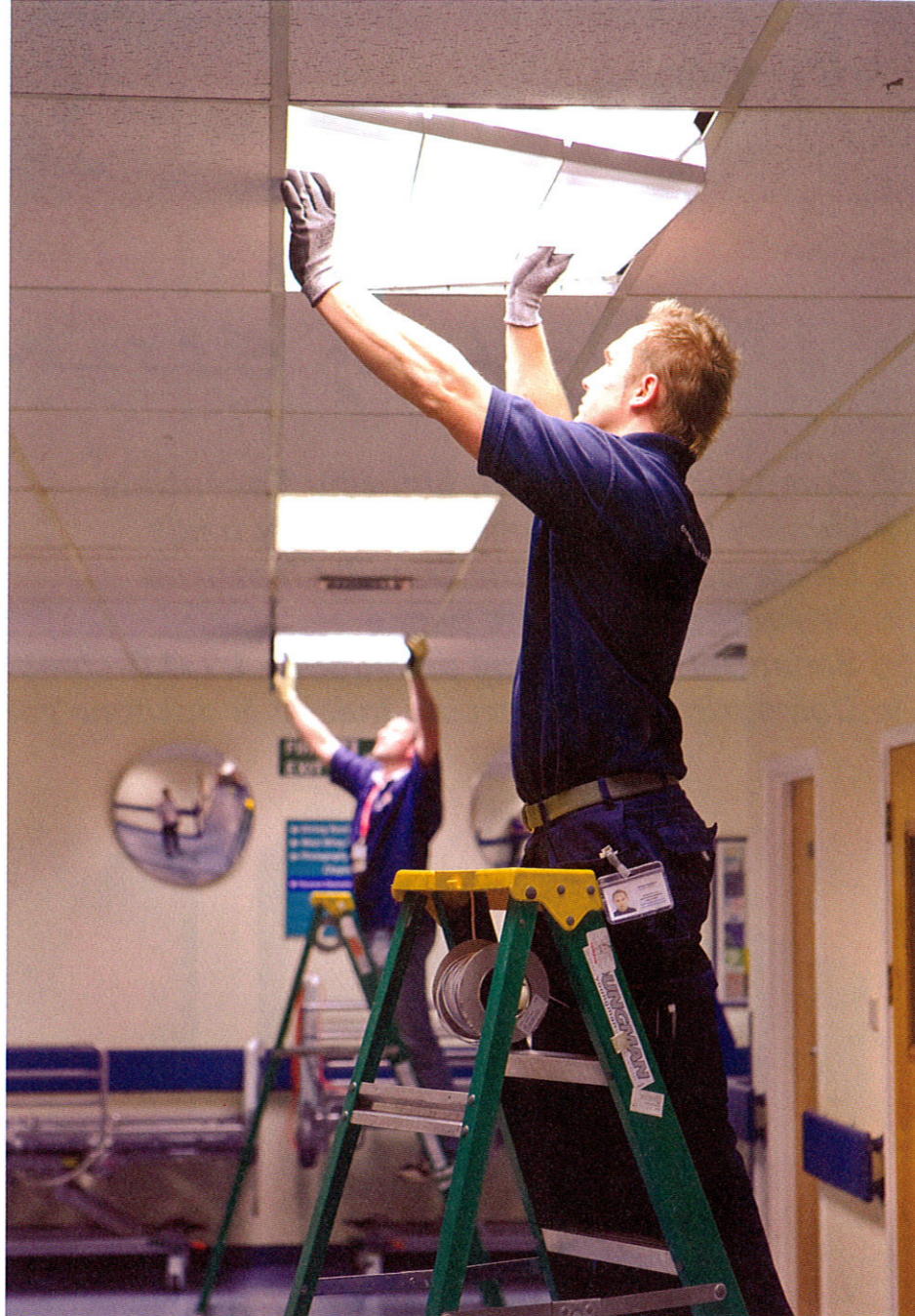
Above: Disruption during luminaire conversion is minimal because the technology does not require the contractor to replace the existing fixtures and fittings.

lamps rated at 35 W. These lamps were used in a multi-storey car park and were lit for 12 hours a day, six days a week.